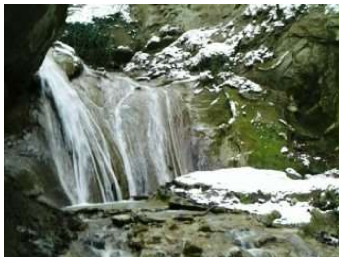
Cascate del Tassarò in veste invernale

Sarà l'occasione per recuperare la precedente cicloescursione del 12 giugno che, causa pioggia ed impraticabilità del guado sul Tassobbio, non si è potuta concludere.