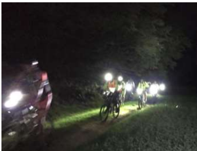
Discesa in notturna